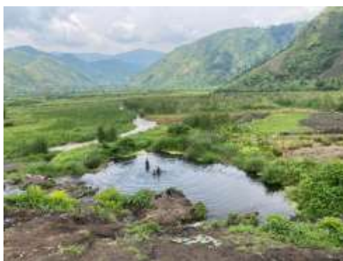
Image7 : Marais de Tingi/sake