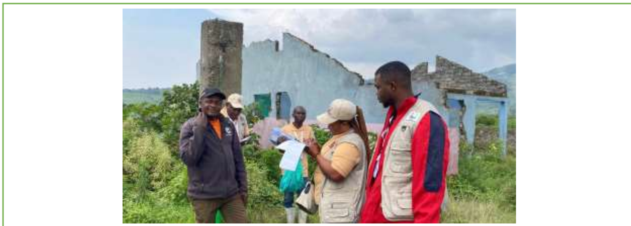
Image 11 : Visite guidée de débris de la fromagerie de Luhonga sous le guide de son PCA