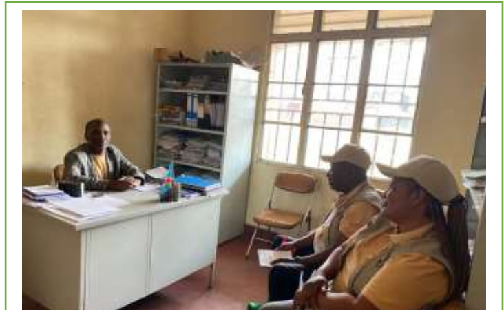
Image 2 : présentation de civilité au groupement kamuronza