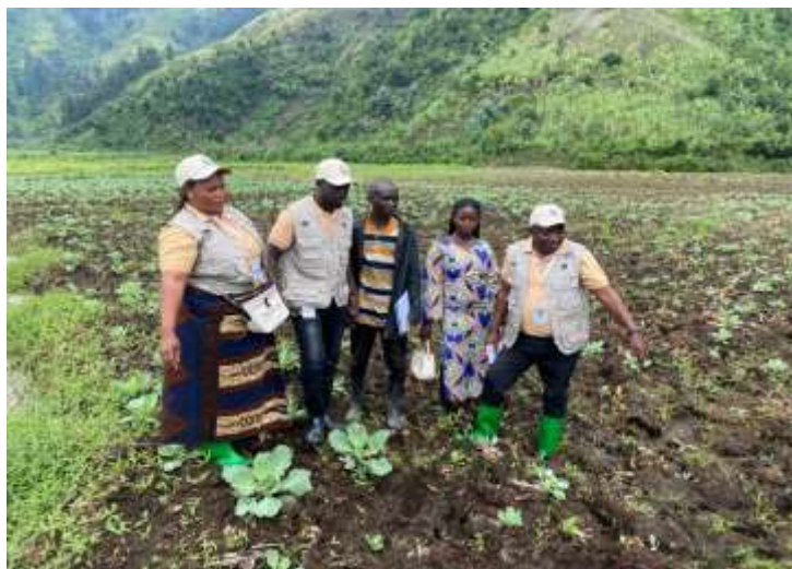
image 9 : choux cultivé par le GST UADK dans le marais de tingi/sake