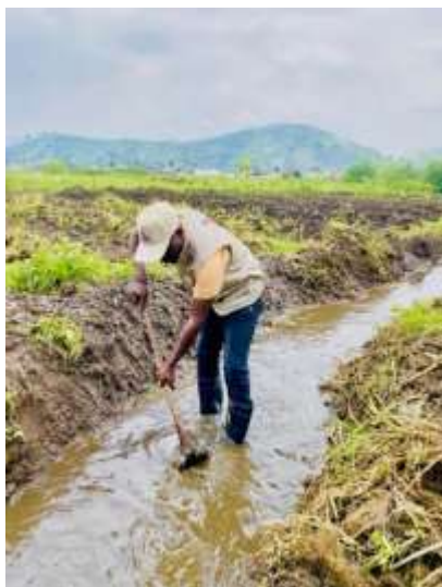
Image 8 : Drainage de marais de Tingi/sake