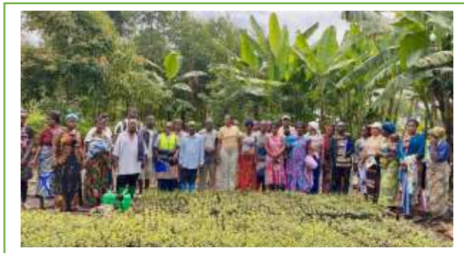
Image 4 : groupe solidaire tuungane