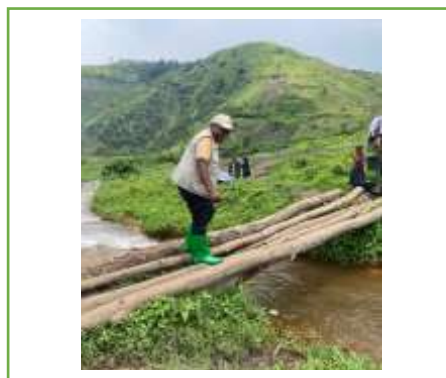
image8 : pont de Tingi